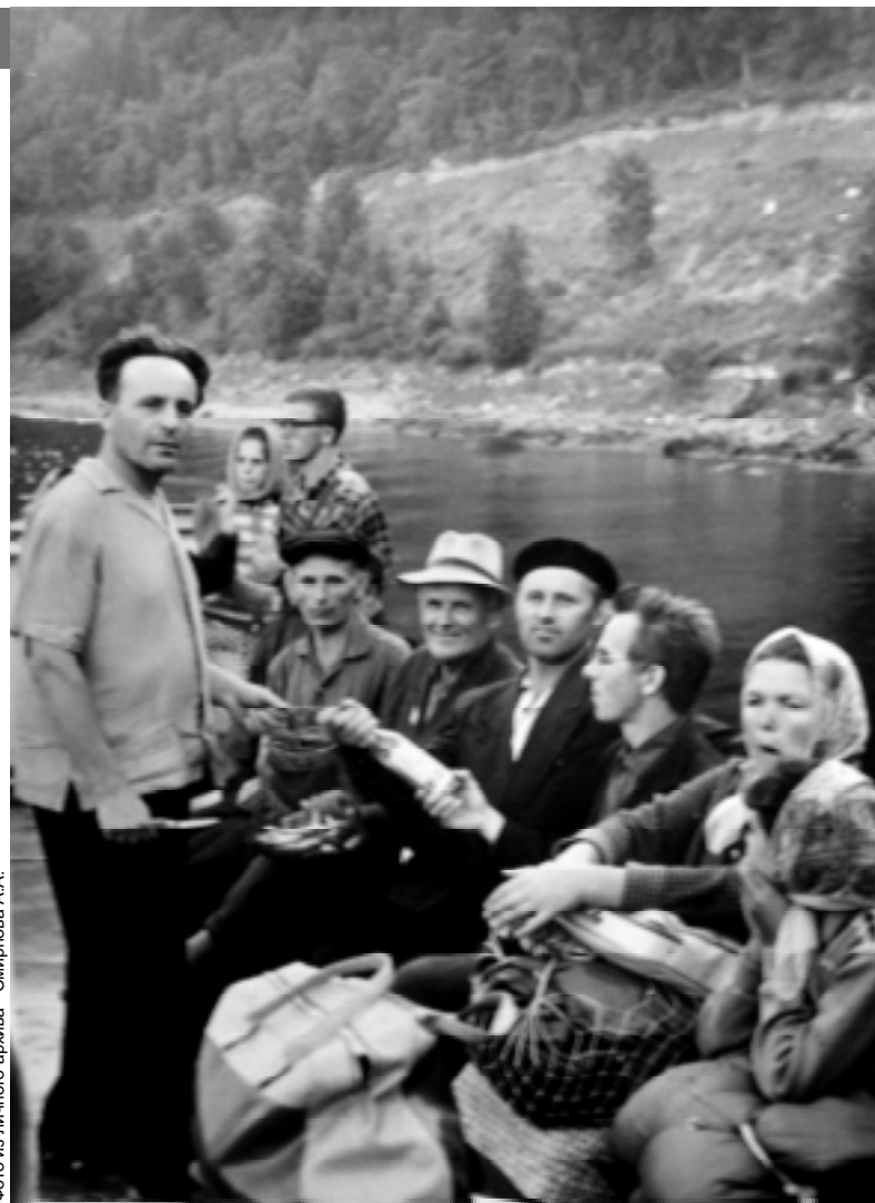
Коллектив радиоцеха отмечает юбилей на природе.