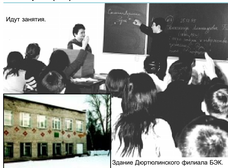
Здание Дюртюлинского филиала БЭК.