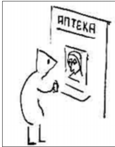
- Доктор сказал: принимайте это лекарство, даже если вам станет хуже. А мне стало лучше. Наверное, это не то лекарство...

Понаблюдайте, как люди ходят, сравните походки тех, кого вы уже хорошо знаете, с походками незнакомых и малознакомых, запомните, запечатлейте в себе эти походки путем подражательного воспроизведения, создайте собрание походок, коллекцию - и перед