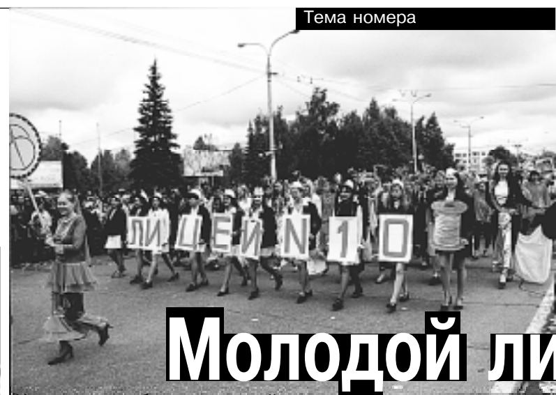
На параде учебных заведений.

*** Вот уже 18 лет в лицее работает Театр моды «Тальма», лауреат многих фестивалей и конкурсов. Театр моды, в составе коллектива лицея, принимал участие в проведении Дней Башкортостана в Москве и выставок на I и II Всемирном Курултае башкир.