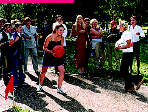
День здоровья, веселые старты.